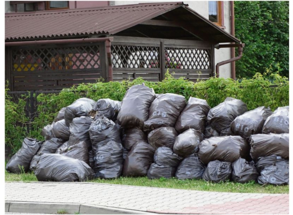
Ilość odpadów zielonych oddawanych przez mieszkańców wzrosła od 2018 roku aż sześciokrotnie.

Wzrost opłaty „śmieciowej” ma na celu zbilansowanie kosztów odbioru i zagospodarowania odpadów w taki sposób, żeby dopłaty z budżetu gminy nie były konieczne. Finansowanie tego zadania ma ułatwić także nowe zasady składowania i odbioru odpadów. Dotyczą one głównie bezpośredniego odda-