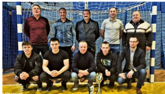
Kolegium Sędziów z Oświęcimia musiało się zadowolić srebrnymi medalami halowych mistrzostw zachodniej Małopolski.

Niedosyt pozostał olbrzymi, bo Wadowice wyprzedziły Oświęcim tylko ko-