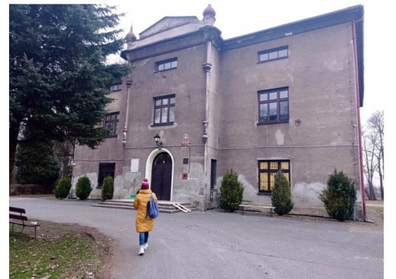
Mieszkańcy Pozytywnego Dworku 12 marca znaleźli się w dramatycznej sytuacji. O pożarze w kotłowni tego budynku piszemy na stronie 4. W Pozytywnym Dworku w Porębie Wielkiej pod koniec lutego mieszkało 14 dorosłych osób i 19 dzieci z Ukrainy.