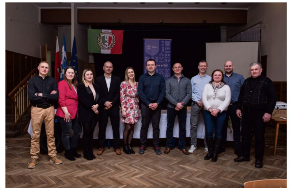
W Ludowym Klubie Sportowym z Poręby Wielkiej wybrano nowy zarząd na kolejną kadencję.