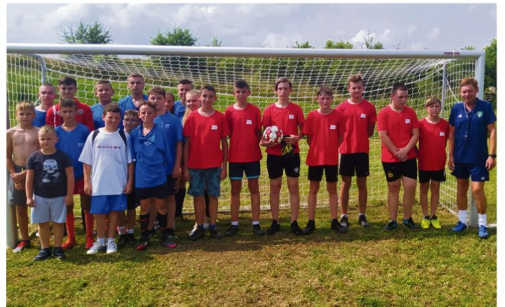
Młodzieżowe reprezentacje OSP Dwory Drugie i OSP Włosienica.

padku drogowego, który najmłodszy obserwował z wycieczkami na buziach. Ostatni punkt programu, czyli taneczna zabawa, trwał do późnej nocy.