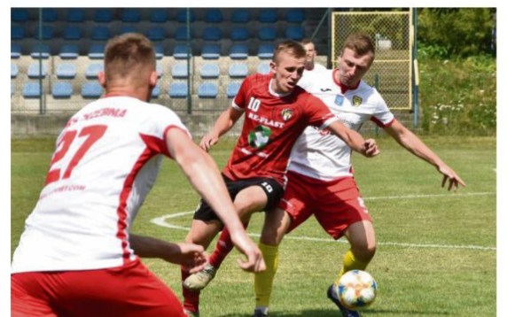
Do rozgrywek okręgówki sezonu 2021/22 piłkarze z Rajsko przystąpią już pod wodzą nowego trenera.