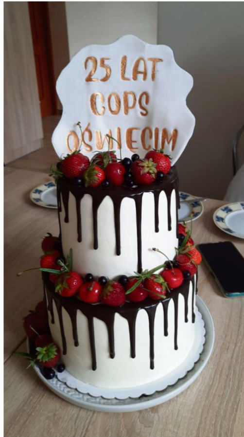
1 lipca pracownicy Gminnego Ośrodka Pomocy Społecznej świętowali 25-lecie tej instytucji. Główną atrakcją – urodzinowy tort – upiekła jedna z pracujących tu pań.