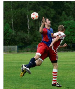
Boys – Sygnał Włosienica, LKS Poręba Wielka – LKS Bulowice, Iskra