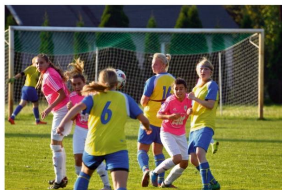
Nadrzędnym celem trzeczoligowych wiceliderok z Brzezinki jest walka o upragniony awans na drugoligowe boiska.

Jeśli chodzi o Iskrę Brzezinka, to dziewczęta już od połowy stycznia przygotowują się do startu rundy rewanżowej w trzeciej lidze. Mają za sobą udział w pierwszej edycji turnieju halowego kobiet o "Puchar Prezesa Podokręgu Myślenice". Organizatorem zawodów był LKS Respekt Myślenice i myślenicki Podokrąg Piłki Nożnej. Oprócz gospodarzy wystąpiły: Wanda Kraków, Prądniczanka Kraków, Iskra Brzezinka, Piast Skawina, LKS Szaflary, Akademia Sportu w gminie Świątniki Górne, KS Dąb Zabierzów Bocheński, Górniki Wieliczka, Akademia Piłkarska Wisła Brzeźnica, Panda LKS Burza Roczyny, Centrum Zdrowia Tuchovia Tuchów, Victoria Gaj i MKS Puszcza Niepołomice.