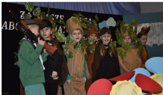
Fot. Tomasz Kłęczar