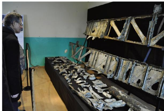
Szcątki bombowca zostały zaprezentowane w 73. rocznicę wyzwolenia KL Auschwitz.

Po spuszczeniu wody ze stawu hodowlanego na pograniczu Rajski i Harmęż z mułu wyłoniły się metalowe szczątki sowieckiego bombowca – dwa duże wiązary skrzydeł. Maszyna została zestrzelona 19 stycznia 1945 roku.