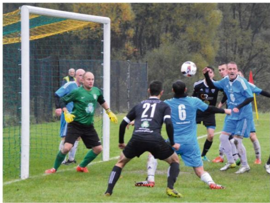
Po pierwszej rundzie rozgrywek oświęcimskiej klasy A piłkarze z Rajksa zajmują pozycję wicelidera z czterema punktami straty do prowadzącego Hejnału Kęty.